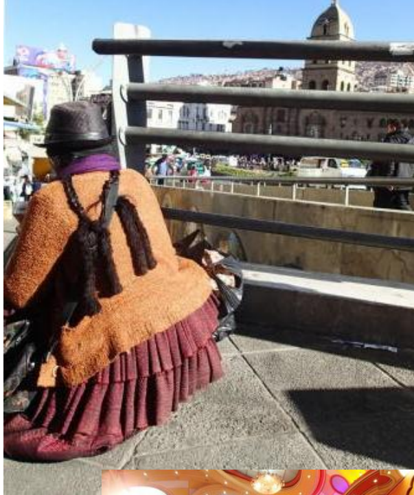
S DIGITAL CAMERA