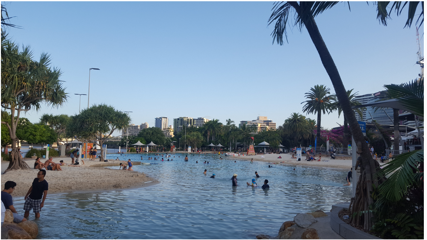
Une plage dans la ville