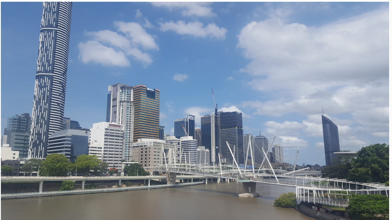
Vue de la ville