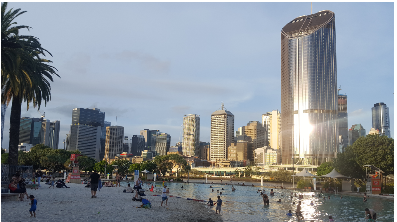
Vue depuis la plage de SouthBank