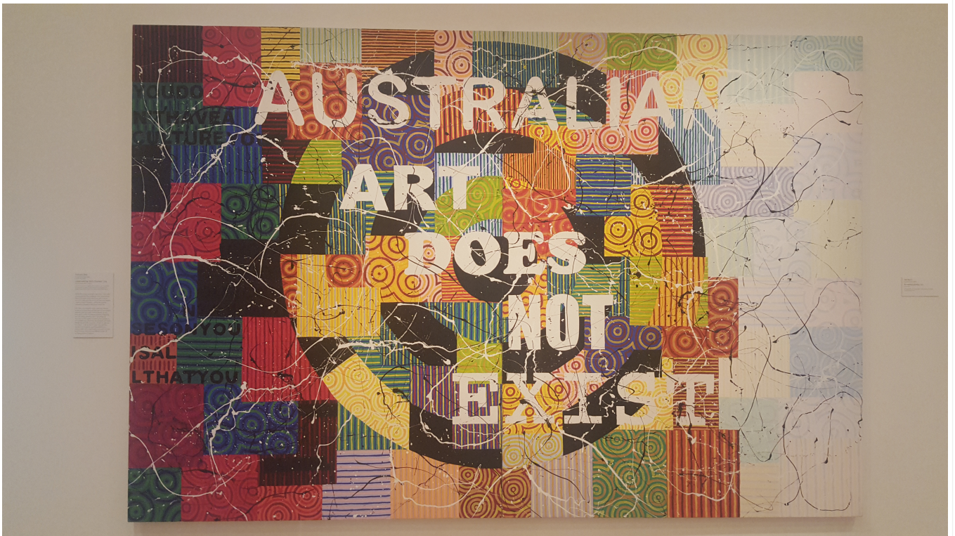
Il n'existe pas qu'un seul art Australien