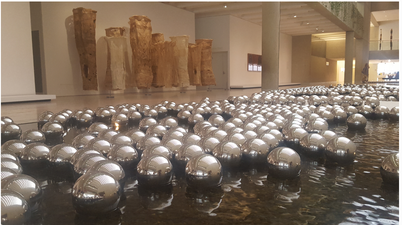
Queensland Art Gallery